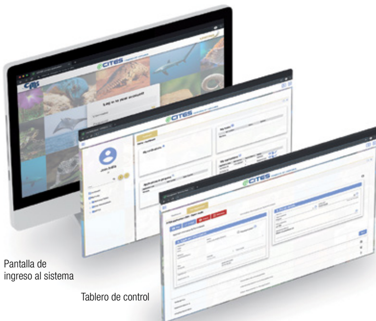
Pantalla de ingreso al sistema

Principales razones para escoger la solución: maximizar el valor comercial (“mejora operativa”) y mantener la relación costo-eficiencia (“relación calidad-precio”) al mismo tiempo que se garantiza una transición fluida y sencilla de los procedimientos actuales al nuevo sistema (“sin interrupciones”).