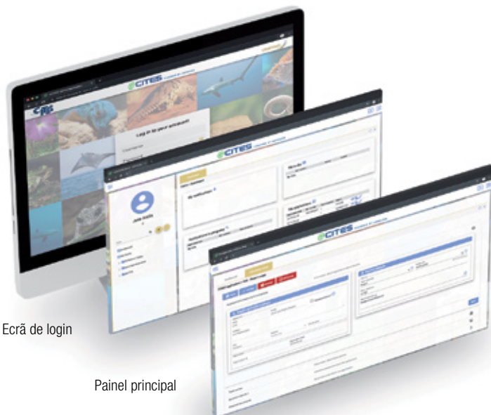
Ecrã de login

Princípios-orientadores e determinantes para a escolha da solução eCITES: Maximização, reforço dos controlos e melhoria operacional da gestão das espécies ameaçadas de extinção; Manutenção da eficiência dos custos ('valor financeiro'); Garantia da transição perfeita dos actuais procedimentos para o novo sistema, sem a interrupção das transações; Implementação da solução tecnológica através de um contrato de assistência técnica entre a UNCTAD e o país beneficiário; Sistema desenvolvido para funcionar em suportes móveis.