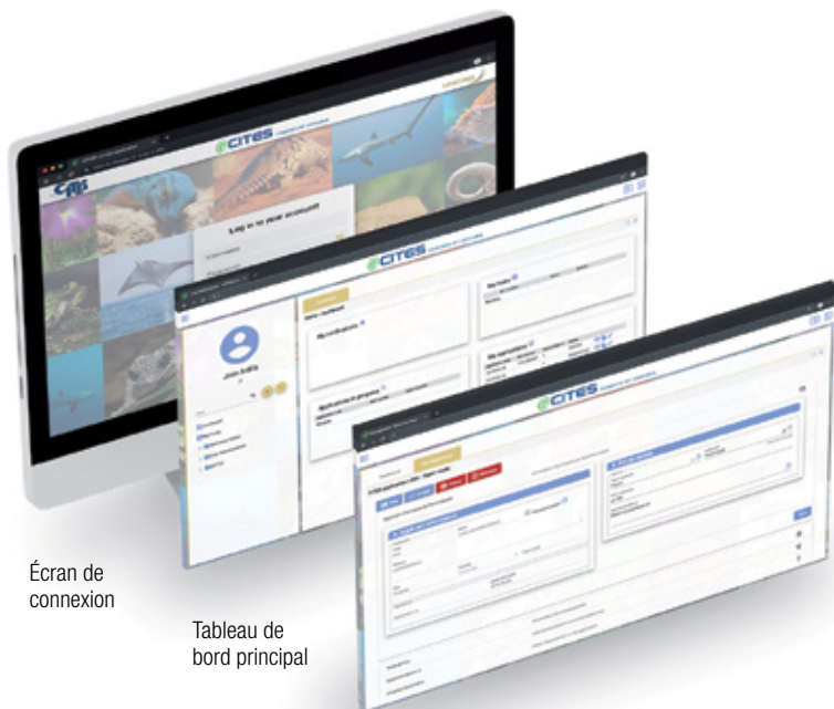
Écran de connexion

Principes clés pour le choix de la solution: maximiser la valeur commerciale («amélioration opérationnelle») et maintenir la rentabilité («optimisation des ressources») tout en assurant une transition transparente des procédures de travail actuelles au nouveau système («aucune interruption»).